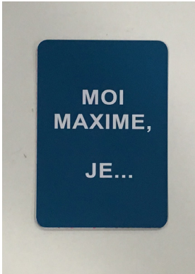
DOS DE LA CARTE