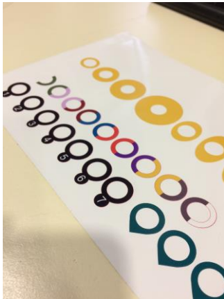
Recherches de différents principes d'autocollants.

Nous avons conçu des autocollants sur le principe de la taille pour définir l'ordre des lettres, un sur l'association de couleurs, un avec des chiffres et des autocollants en forme de flèches pour guider vers la lettre suivante.